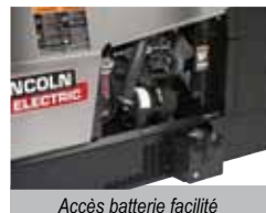
Accès batterie facilité