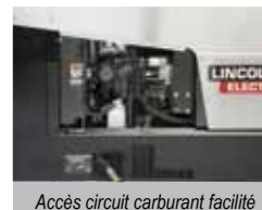
Accès circuit carburant facilité